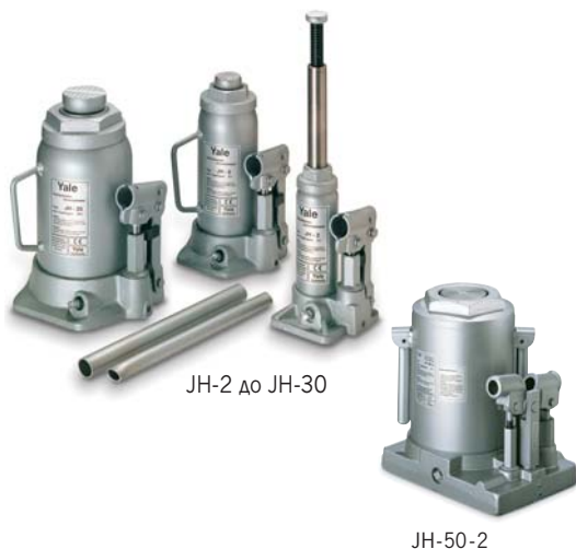
JH-2 до JH-30