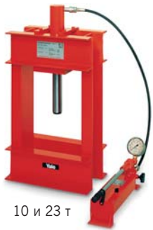
10 и 23 т

предназначены для предприятий и мастерских, для всевозможных работ связанных с прессовкой. Рама пресса массивна и неэластична и тем самым позволяет производить точную прессовку. Все поставляемые прессы полностью оснащены гидравлическими компонентами и готовы к эксплуатации. В прессах от 50 тонн серийно установлены двусторонние цилиндры и рабочая плита. Управление прессом осуществляется в зависимости от выбора ручными, электро- или пневмонасосами. Все прессы выполняются в соответствии с действующими нормативными документами и требованиями.