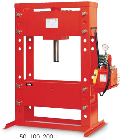
50, 100, 200 т